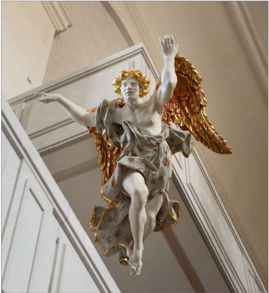
Barocker Verkündigungengel in der Dresdner Dreikönigskirche